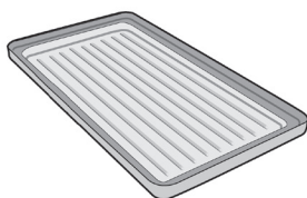
Plaque croque-monsieur et grill (x 2)